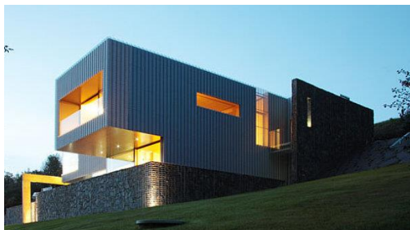
Vila v Beskydech podle návrhu architekta Zdeňka Trefíla. autor: Robert Žákovič

Dozvěděl jsem se o ní v roce 2012 na Letní škole architektury v Rožnově pod Radhoštěm, kde učil architekt Zdeněk Trefil. Během své přednášky představil vilu, která se právě začala stavět ve východní části Beskyd a jejíž vizualizace působila až neskutečným dojmem.